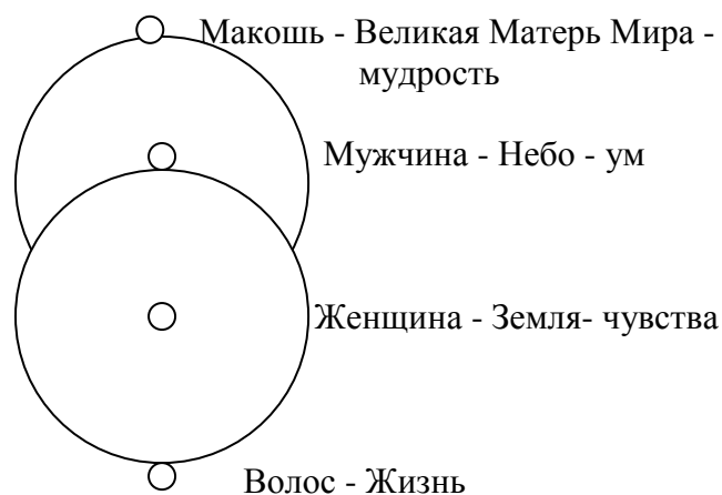
Рис. 3 - ДОРИСОВАТЬ!!! И рядом человека с тремя тройками и вытянутыми вверх руками И рядом эту же картинку но уже как мировое яйцо и внутри восьмёрка

Ещё один интересный штрих. Мы с вами знаем о трёх центрах любви: голова, грудь и тазовая область. Так вот в той же книге "Мир Тропы" старики говорят, что в голове живёт дева София - Мудрость. Проверим.