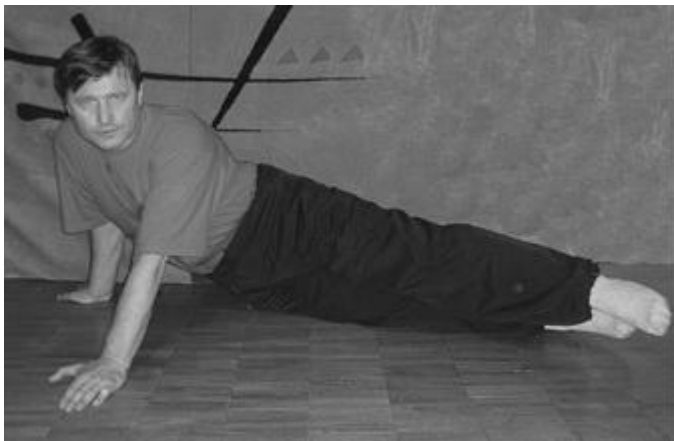
Рис. 4 Тюлень

Упражнение 6.1.6. «Тюлень» (рис. 4). Положение «упор лёжа» не меняя положения коснуться бедром пола сначала правой стороной, затем левой. Пауза в неудобную сторону.