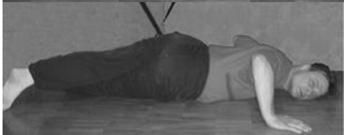
Рис. 8. Скручивание лёжа

Упражнение 6.1.12. Для пресса. Лёжа на спине поднять руки и ноги + пауза (рис. 9).