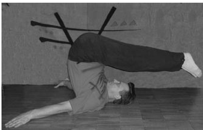
Рис. 1. Упражнение Ванька-встанька

Упражнение 6.1.4. «Кошка сердится». Стоя на коленях выгнуть спину, затем прогнуть её (рис. 2). Пауза в прогибе.