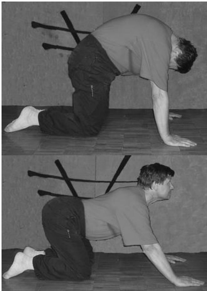
Рис. 2. Кошка сердится

Упражнение 6.1.5. «Кошка гоняется за хвостом» (рис. 3). Стоя на коленях оторвать ступни от пола и одновременно с головой повернуть их вправо, затем влево. Пауза в неудобную сторону.