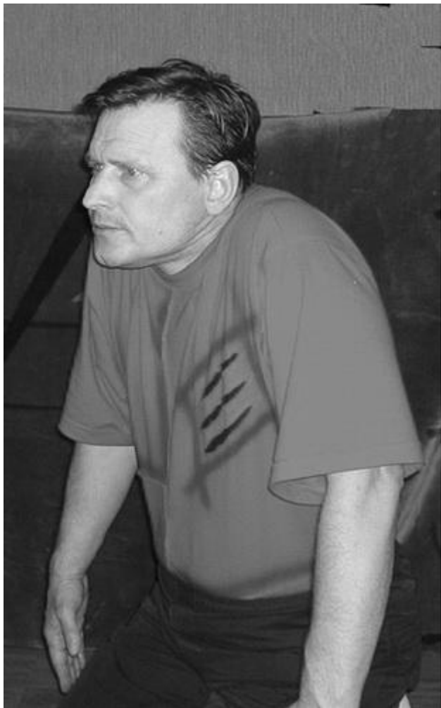
Рис. 12 Плуг Рис. 13 Шея