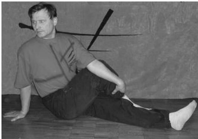
Рис. 7. Скручивание