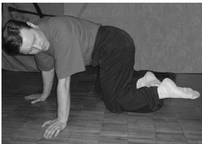
Рис. 3 Кошка с хвостом

Упражнение 6.1.5. «Кошка гоняется за хвостом» (рис. 3). Стоя на коленях оторвать ступни от пола и одновременно с головой повернуть их вправо, затем влево. Пауза в неудобную сторону.