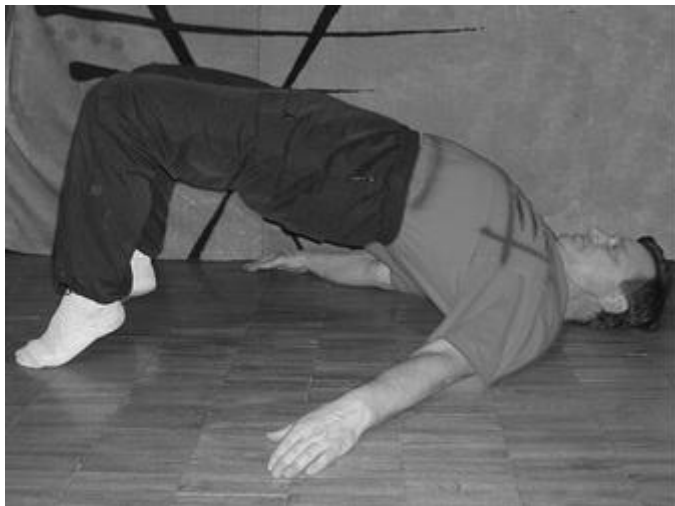
Рис. 11 Полумост