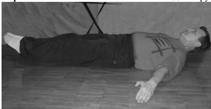
Рис. 9. Для прсса

Упражнение 6.1.13. Лёжа на животе поднять руки и ноги лодочка + пауза (рис. 10)