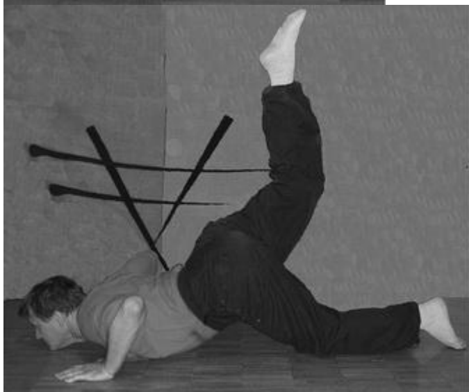
Рис. 5 Присядания Рис. 6. Отжимания

Упражнение 6.1.10. Скручивание сидя (рис. 7).