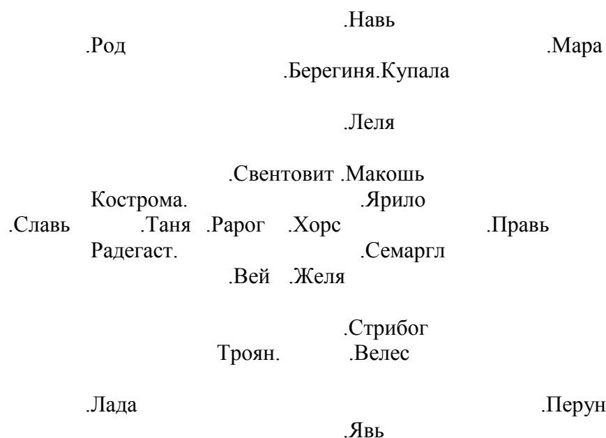
Рис. 1 Звезда Ра.

Из полученного магического квадрата легко вытекает дошедшая до нас звезда Ра, которую иногда называют ещё звездой Перуна (рис.5). Звезда Ра имеет ровно 24 пересечения (точки), что позволило нашим предкам разместить на ней весь русско-борейский божественный Пантеон, а в центре поставить 25-ю точку, принадлежащую Ра - главному року.