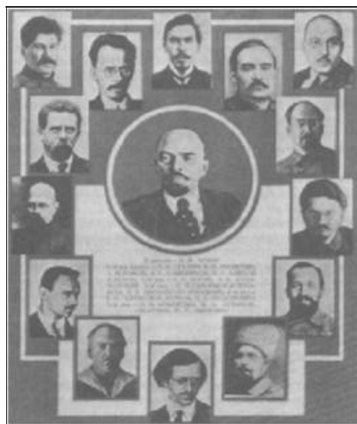
СОВЕТ НАРОДНЫХ КОМИССАРОВ, избранный на Втором всероссийском съезде Советов рабочих и солдатских депутатов В центре — В. И. ЛЕНИН

Весь этот ужас и произошёл с Россией. Сначала троцкистская группировка, прикрываясь передовыми лозунгами, в октябре 1917 года пришла к власти. Потом устроила в стране совершенно ненужный красный террор. Именно он и спровоцировал гражданскую войну. А потом, за счёт честных большевиков и народа, победив в междоусобице, Троцкисты вспомнили про тезис Маркса: так как мировая революция не удалась, значит, в России необходима реформация капиталистических отношений. Вот почему появилась потребность в провозглашении знаменитой НЭП. И не надо обелять Ленина, что он якобы сделал отступление в пользу мелкой буржуазии ради оживления в стране товарно-денежных отношений.