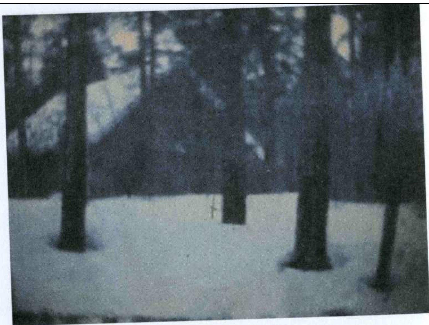
Скит сибирских челдонов