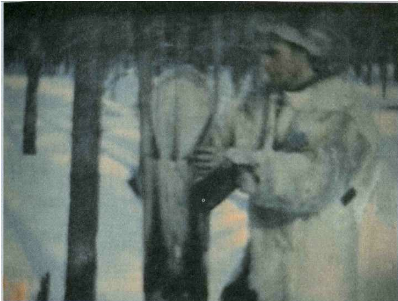
Автор в эвенкийской кырняжке