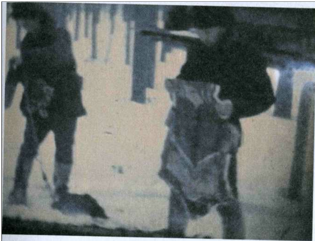
Кадры из любительского фильма, февраль 1975 г.

Кадры фильма об экспедиции, организованной автором в поисках следов Сибирской Руси. Февраль, март 1975 г.