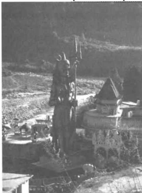
Тааба 25 Дебидтсура