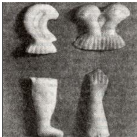
Вотивы из воска. Хорватия.

выпаса, окуривали воском при различных болезнях. Первые состриженные волосы ребенка облепляли воском, и хранили в доме.