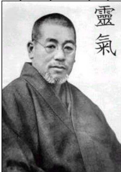
Микао Усуи и написание " Рэйки " в старояпонском стиле

И еще Франк А. Петтер включил в книгу собственное понимание различных предметов и тем, рассмотренных через призму независимого мастера Рэйки .