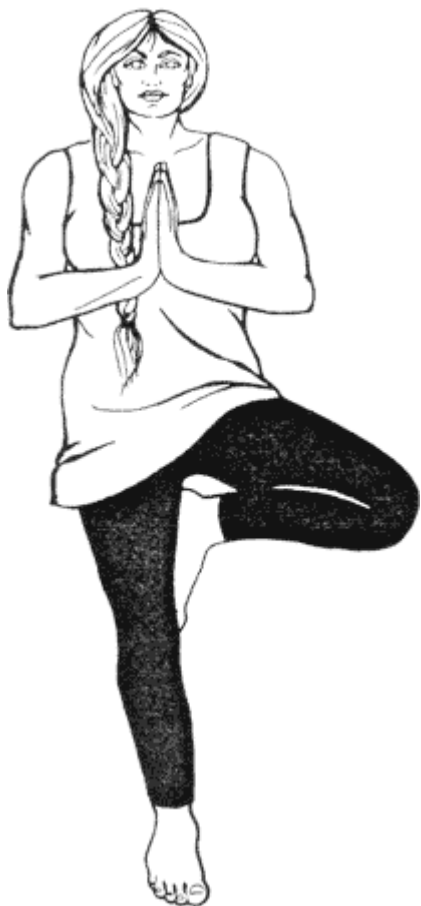
Рис. 2. Достигните равновесия в "позе дерева"

Когда вы впервые попытаете принять такую позу, то наверняка будете раскачиваться вперед и назад, пытаясь достичь желаемого состояния. Вы будете напрягать мышцы ног и живота, пытаясь добиться равновесия, но по-прежнему останетесь совершенно неустойчивы. И внезапно вы попадете в состояние равновесия. Вы достигнете центральной точки, которая, несомненно, существует! И по мере того как вы будете становиться более опытными, принятие этой позы станет для вас все более и более легким делом. Хотя некоторые колебания тела все еще сохранятся, они станут менее значительными.